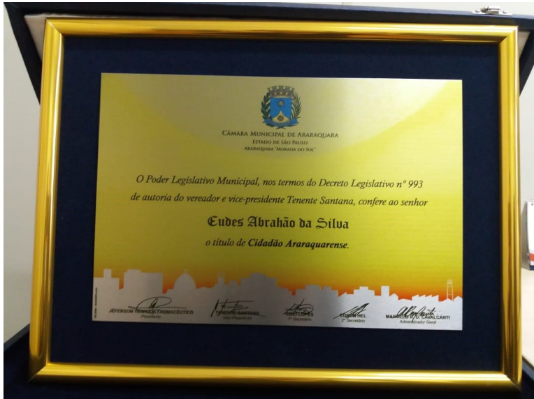
Placa com impressão personalizada e permanente de alta qualidade

Processo de Compra nº 029/2022 - Pregão Presencial nº 002/2022 - Tipo: Menor preço Objeto – Contratação de fornecimento de placas de homenagens, cartões de prata e medalhas