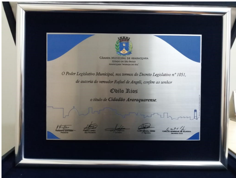
Placa aço inox escovado com gravação baixo relevo