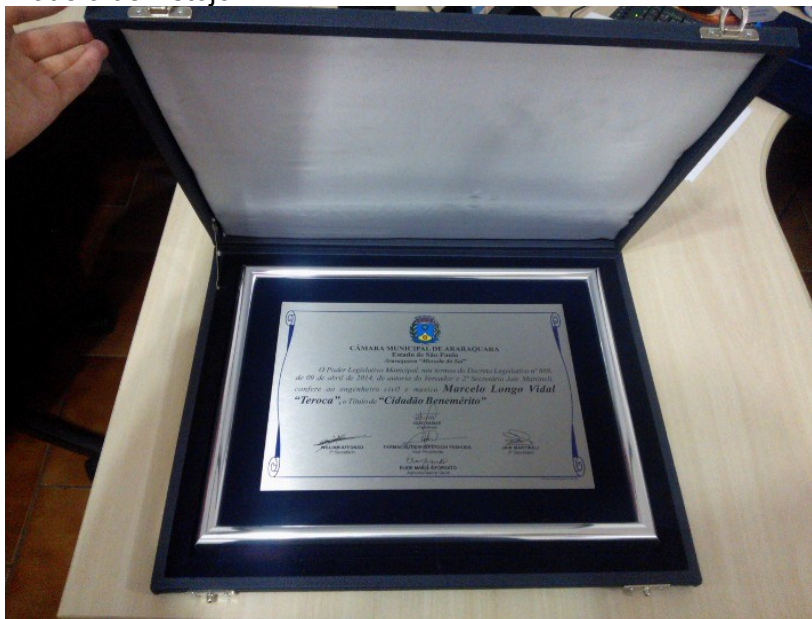
Modelo de Estojo