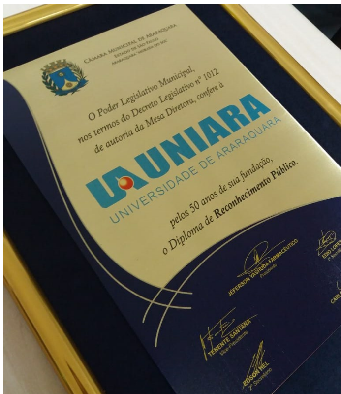
Placa de latão com gravação de impressão