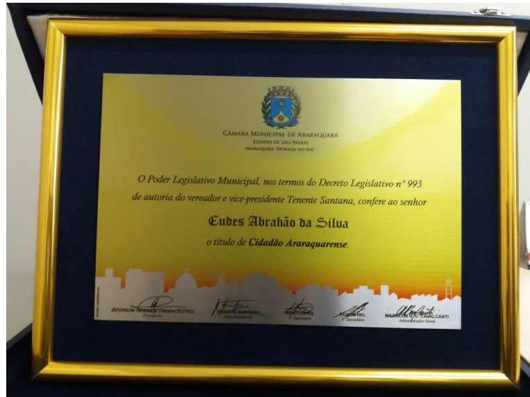
Placa com impressão personalizada e permanente de alta qualidade

Processo de Compra nº 097/2020 - Pregão Presencial nº 003/2021 - Tipo: Menor preço Objeto – Contratação de fornecimento de placas de homenagens, cartões de prata e medalhas