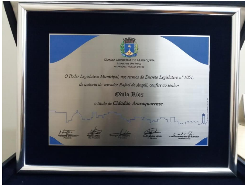
Placa aço inox escovado com gravação baixo relevo