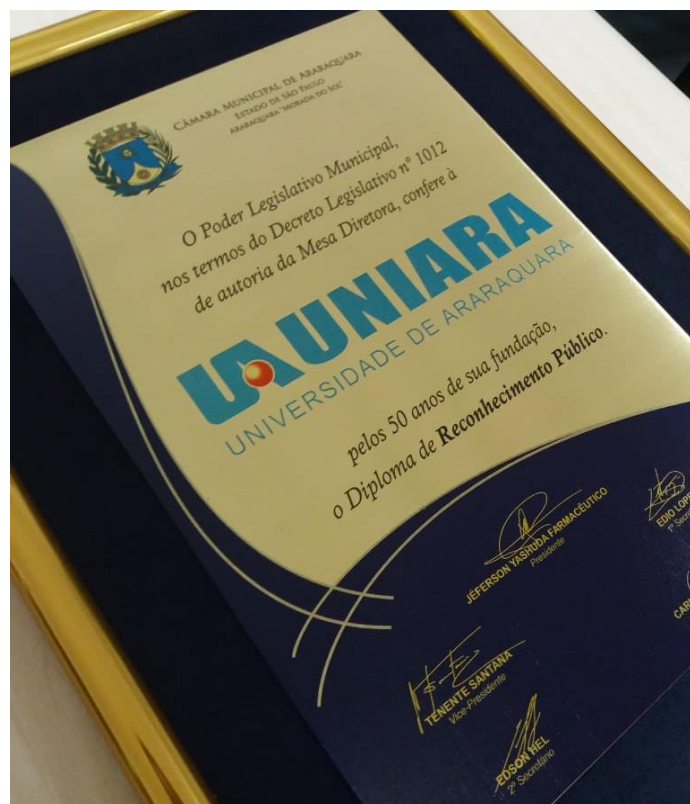
Placa de latão com gravação de impressão