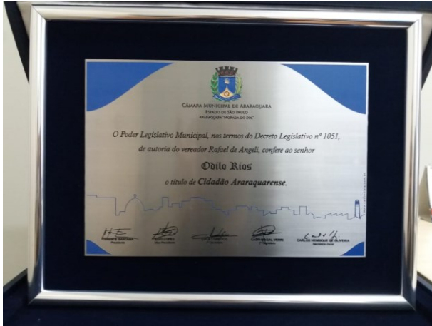
Placa aço inox escovado com gravagem baixo relevo