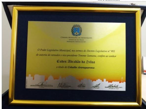
Placa com impressão personalizada e permanente de alta qualidade

Processo de Compra nº 025/2023 - Pregão Presencial nº 003/2023 - Tipo: Menor preço Objeto – Contratação de fornecimento de placas de homenagens, cartões de prata e medalhas