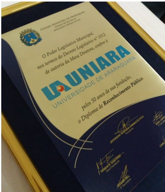
Placa de latão com gravagem de impressão